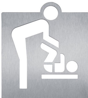
Référence : WAC-420