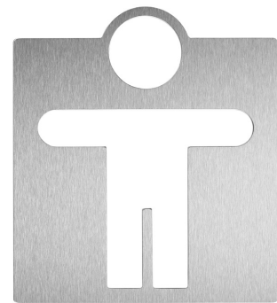
Référence : WAC-200