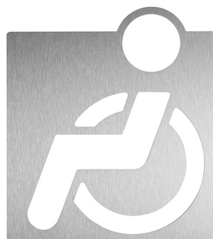
Référence : WAC-230