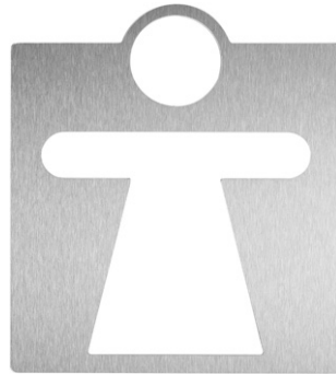
Référence : WAC-210