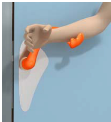
Utilisation sans les mains