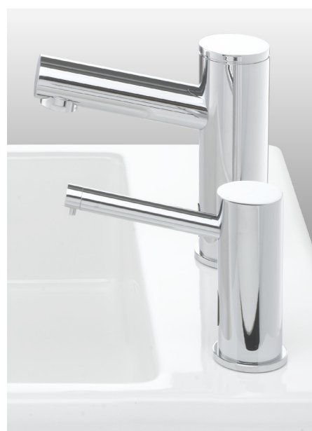
Avec robinet électronique ELITE