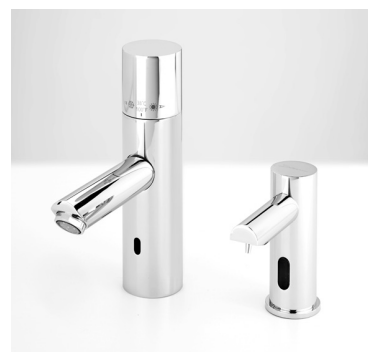
Design assorti robinet AKWATHERMO