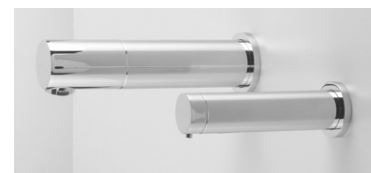
Avec robinet électronique RONDEO