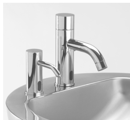
Avec robinet électronique EXTREME