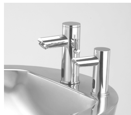
Avec robinet électronique SMART