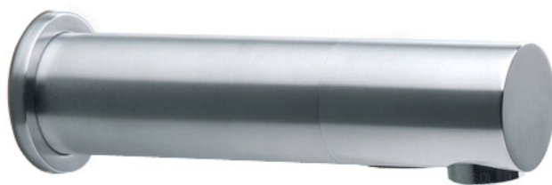
Inox AISI 316 - Haute résistance et design contemporain

La robinetterie électronique préserve l'eau, économise l'énergie et optimise l'hygiène des sanitaires.