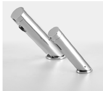
Avec robinet électronique TOUCH FREE