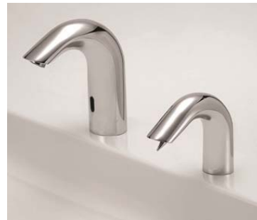
Avec robinet électronique ALLURE